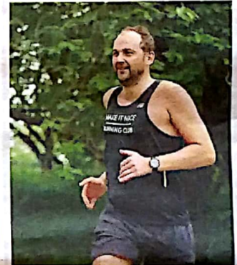
Stelle Michelin Daniel Humm, 41 anni, svizzero