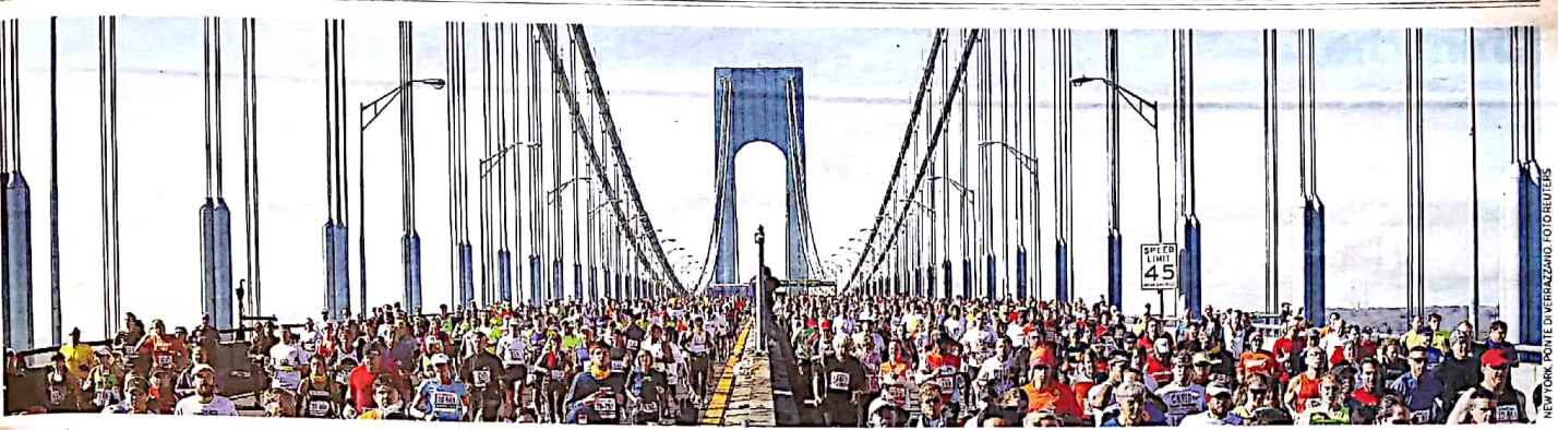
NEW YORK. PONTE DI VERRAZANO.