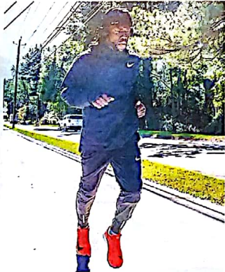
Per i follower Kevin Hart, 38 anni, di Filadelfia