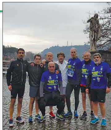
La gara Con le magliette di Avanti Tutta

Cenci avrebbe dovuto partecipare, come viene ricordato sulla pagina facebook dell'associazione da lui fondata. Sull'account ufficiale del presidente del Comitato olimpico nazionale italiano si legge: "Felice di aver partecipato a un'altra