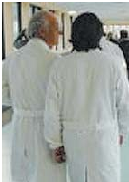
Medici L'intramoenia finisce nel mirino per colpa delle liste d'attesa troppo lunghe

gime di visite a pagamento nelle strutture pubbliche, meglio conosciuta come prestazione in intramoenia, che garantisce consistenti entrate anche alla struttura pubblica". Posto che, fra l'altro, "i cittadini che si rivolgono all'intramoenia si troverebbero nell'alternativa visita privata o programmata", il consigliere vorrebbe impegnare sindaco e giunta ad avviare "un confronto presso la competente commissione consiliare tra la Regione e i rappresentanti sanitari per discutere e prospettare soluzioni alternative ed integrative per abbattere le liste".