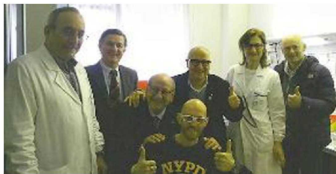
SORRISI La cerimonia di donazione delle nuove poltrone

«La scelta, come sempre è stata mirata: serviva sostituire alcune poltrone e acquistarne una per la nuova postazione»