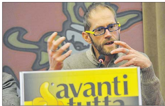
Albo d'oro L'ennesimo riconoscimento arriva dal Comune