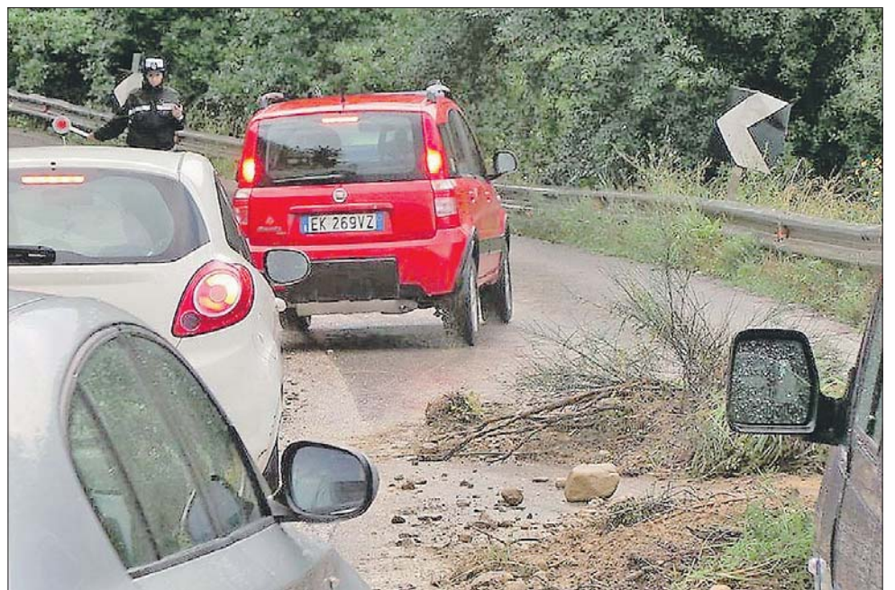
Prevenzione Il Comune attende risposte sui progetti preliminari per cui ha chiesto un finanziamento