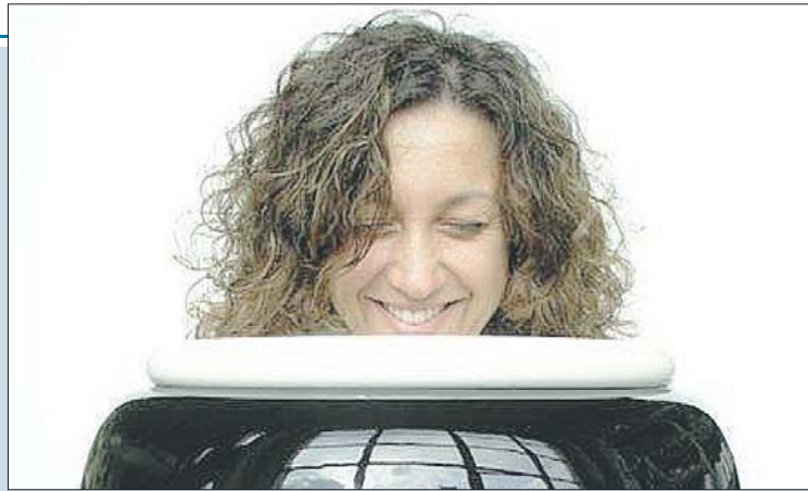
Artista Con la Grelli ogni bambino ha portato qualcosa da casa

2° circolo didattico di Perugia. All'interno della mostra saranno esposti i lavori dei bambini coinvolti tra cui "tavole tattili", oggetti in ceramica realizzati con la tecnica arabo-spagnola della "Cuerda Seca" e oggetti preziosi ottenuti dalla particolare cottura Raku. Protagoniste assolute le emozioni